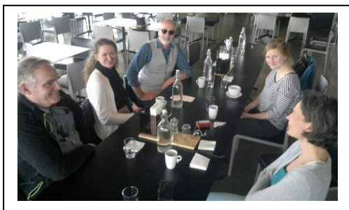
Hilsen Konservatorene NKF-N i Trondheim

Styreleder til NKF-N ba om å diskutere muligheten for å ha neste årsmøtet NKF-N i Trondheim. Denne ideen ble tatt imot meget positivt! Planen er å sette ned en arbeidsgruppe for å samle ideer og komme tilbake med disse til NKF-Ns styre.